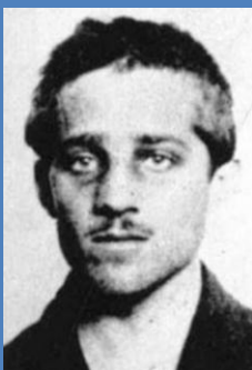
4 Gavrilo Princip - atentátnik

➤ Druhá balkánska vojna - Dva dni po podpise Londýnskej mierovej zmluvy Srbsko a Grécko (neskôr sa ku nim pridala Čierna Hora) podpísali tajnú zmluvu namierenú proti Bulharsku . Napätie medzi krajinami balkánskeho zväzu postupne vyprovokovalo novú vojnu. Bulharsko bojovalo o územia proti svojim bývalým spojencom z Balkánskeho zväzu ( vo vojne bojovali Srbsko, Grécko, Čierna Hora, Rumunsko a Osmanská ríša). Cieľom bolo usporiadať územné požiadavky krajín Balkánskeho polostrova.