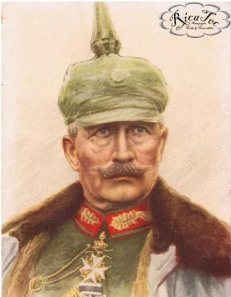
5 Nemecký cisár Wilhelm II.

Srbsko požiadalo o pomoc Rusko, ktoré potom vyhlásilo vojnu Rakúsko-Uhorsku. Následne sa do vojny zapojilo Nemecko a Francúzsko. Veľká Británia vstúpila do vojny, keď Nemecko napadlo Belgicko. Po vypršaní ultimáta 28. júla 1914 Rakúsko-Uhorsko vyhlásilo Srbsku vojnu . Srbsko požiadalo o pomoc Rusko, ktoré potom vyhlásilo vojnu Rakúsko-Uhorsku. Následne sa do vojny zapojilo Nemecko a Francúzsko. Veľká Británia vstúpila do vojny, keď Nemecko napadlo Belgicko. K mocnostiam Dohody sa pripojilo aj Japonsko, ktoré mal záujem o nemecké koloniálne panstvo v Tichomorí a Číne, kým k Ústredným mocnostiam - k Trojspolku sa pridalo Turecko. Tak začala I. svetovej vojna.