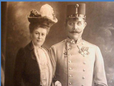
Obrázok 2 následník trónu Ferdinand d Este manželkou