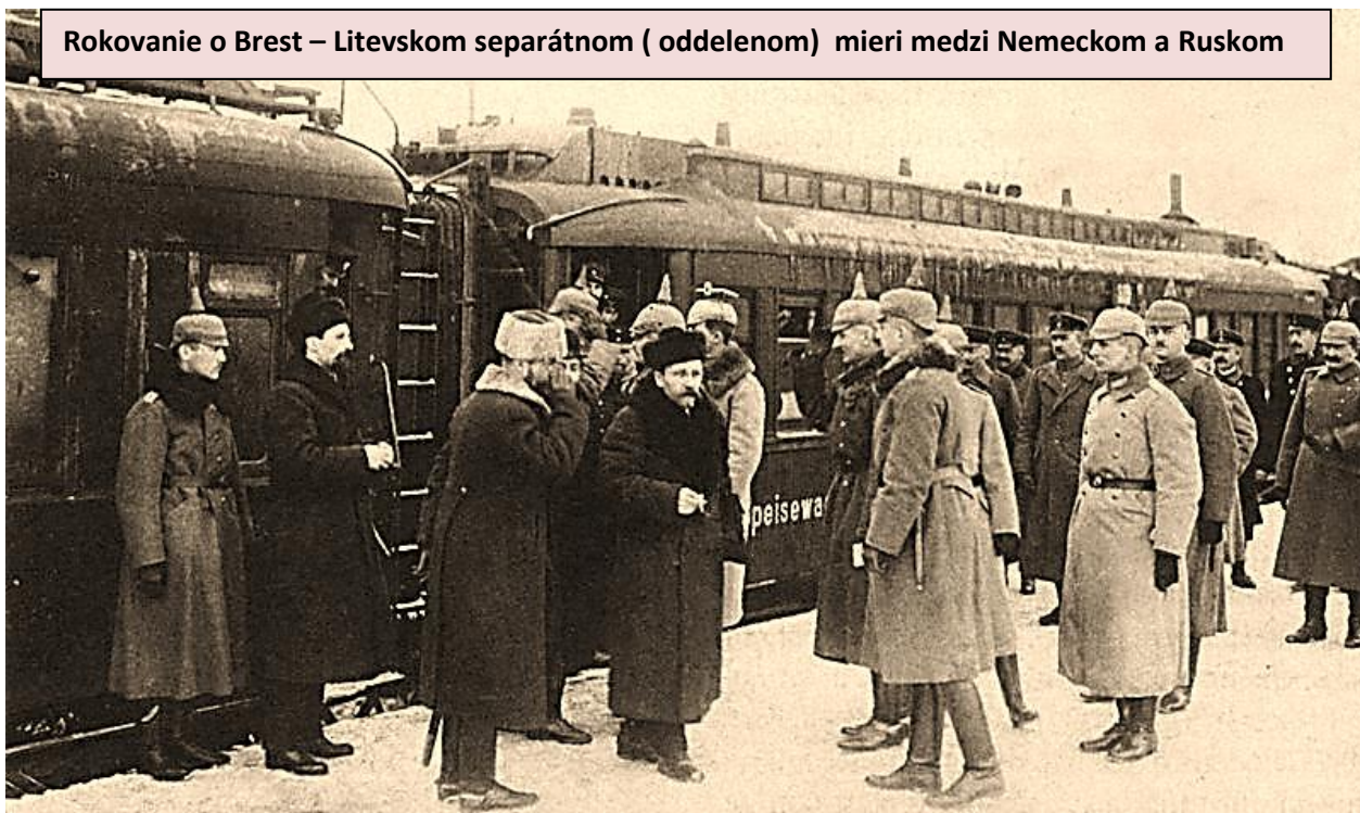
Rokovanie o Brest – Litevskom separátnom ( oddelenom) mieri medzi Nemeckom a Ruskom

Južný front : Na talianskom fronte bola úspešná nemecká armáda - r. 1917 – 1918 sa boje presunuli do Álp. V júni 1918 boli rakúsko-uhorské vojská porazené v bitke na rieke Piave . Koncom júna vstúpilo na strane Dohody do vojny aj Grécko , čo znamenalo vytvorenie nového balkánskeho frontu na jeho severných hraniciach. Rakúsko – uhorská