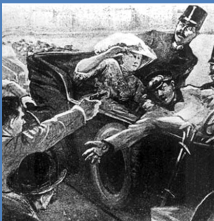
3 Sarajevský atentát