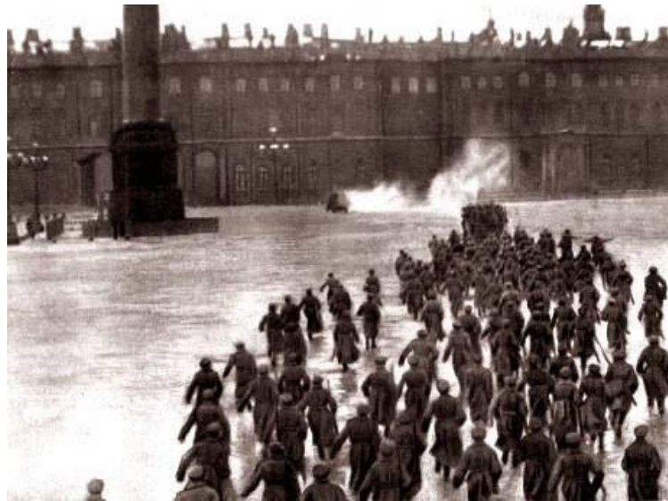
Útok na sídlo Dočasnej vlády – Zimný palác

O bolševikoch sa v Rusku do apríla 1917 veľa nevedelo. O Februárovej revolúcii sa Lenin dozvedel vo Švajčiarsku z novin. Nemecký cisár Wilhelm II. a nemecký generálny štáb prišli na myšlienku ako vyhrať vojnu na východnom fronte. Leninovi finančne pomáhali, pretože chceli v Rusku podnieť revolúciu. Chceli tam vyvolať chaos, aby Rusko vyradili z vojny. Začiatkom roku 1917 V. I. Uljanov – Lenin žil v politickom exile vo švajčiarskom Zurichu. Podľa neho proletariát (robotnícku triedu) majú viesť profesionálni revolucionári. Odmietal reformy a pokojnú evolučnú cestu k socializmu. Presadzoval násilné zvrhnutie kapitalizmu (teória socialistickej revolúcie).