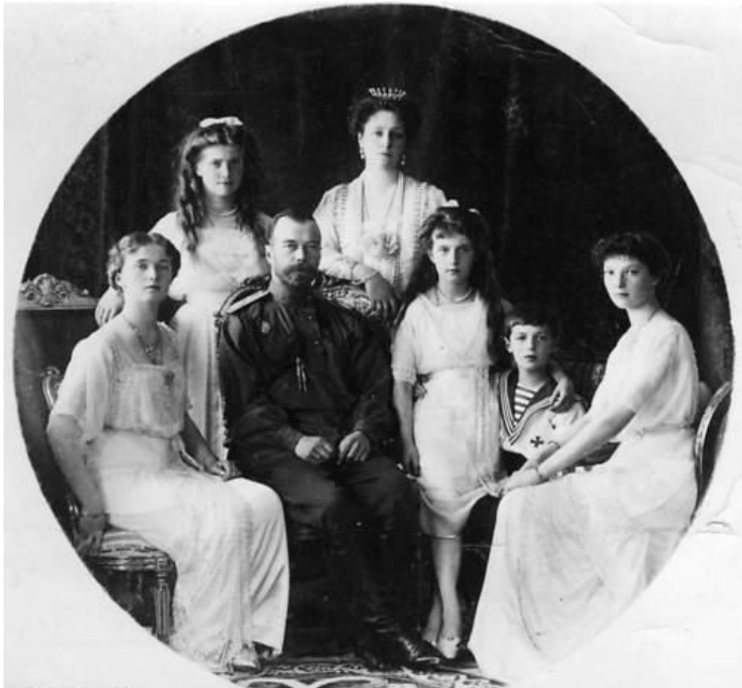
Bundesarchiv, Bild 183-R03964 Foto: o. Ang. | 1910 ca.