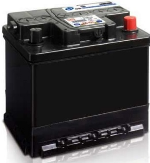
Akumulátor do automobilu

Elektrický akumulátor, kyslé akumulátory, alkalické akumulátory