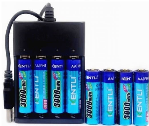
Nabíjateľné batérie resp. akumulátory

Po pripojení k uzavretému elektrickému obvodu sa potom akumulátor postupne vybíja.