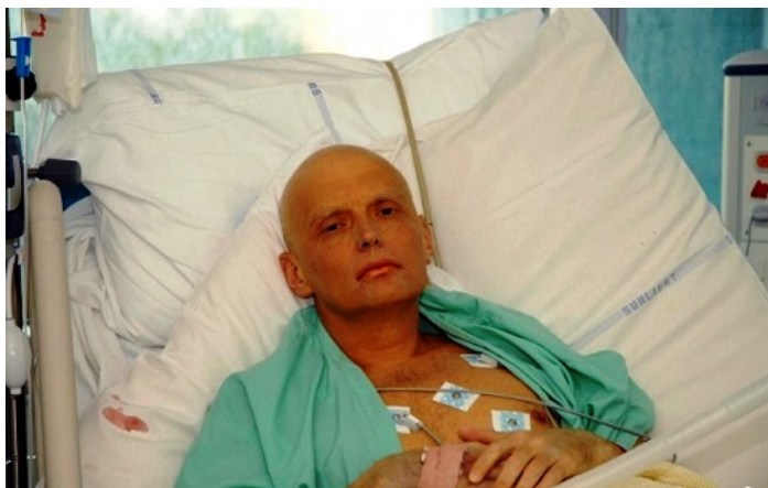
Litvinenko v londýnskej nemocnici

Roku 2006 - v londýnskej nemocnici zomrel na následky otravy bývalý ruský špión Alexander Litvinenko. Bývalý agent KGB a FSB obvinil pred smrťou zo zodpovednosti za atentát na svoju osobu ruskú tajnú službu.