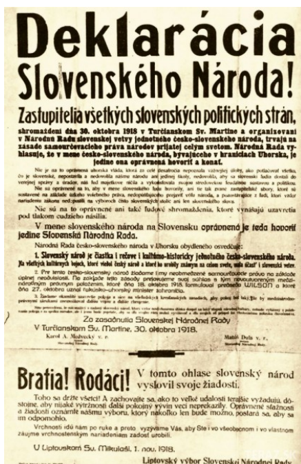
Deklarácia slovenského národa

Vznik spoločného štátu Čechov a Slovákov