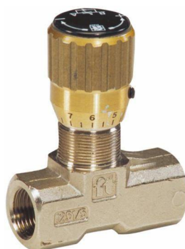
Fotografia škrtiaceho ventilu

Sú drahé na vyhotovenie, necitlivé na viskozitu, citlivosť nastavenia je veľká.