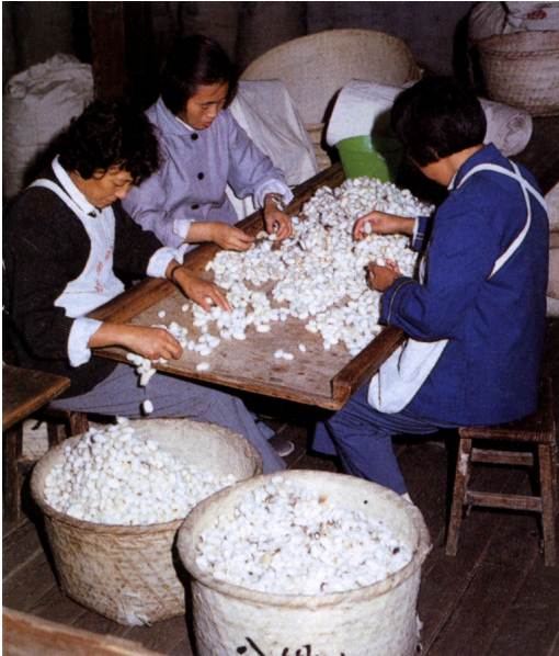
Ženy pri triedení odstraňujú poškodené zámotky. Na každom zámotku je namotané asi 1,6 km vlákna.