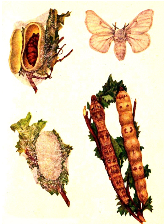
Vývoj priadky morušovej

Hodváb sa už dlhé tisícročia predáva z východu na Západ a pritom si stále zachováva popredné miesto medzi ušľachtilými látkami.