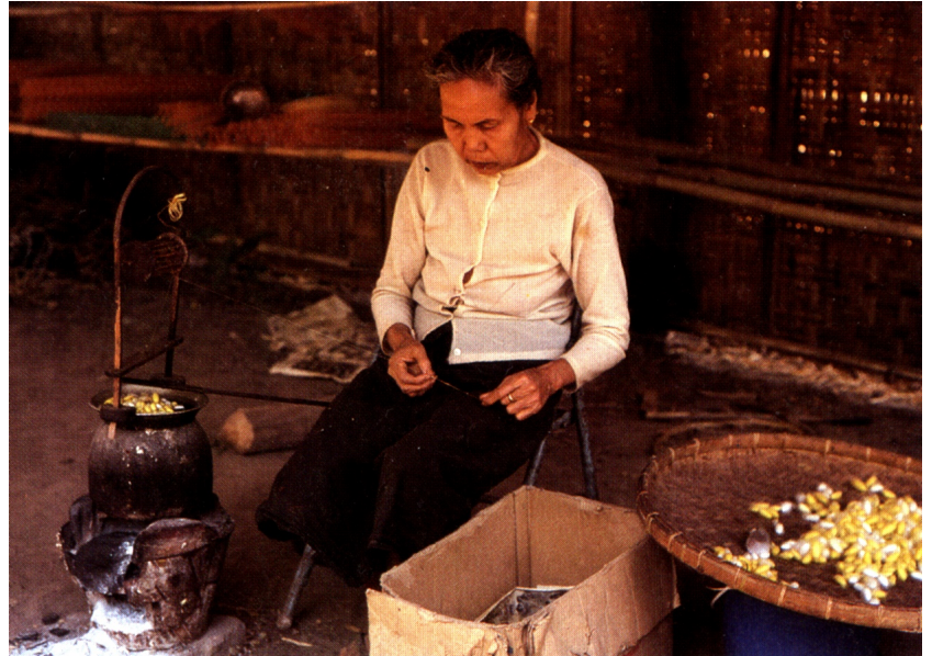
Tradičný spôsob namotávania hodvábného vlákna spočíva na zahriatí umytých zámotkov a zvinutí vlákna do jednej dlhej nite. Rôznofarebné nite, sfarbené chemikáliami s výlučkou húseníc, sa vyvárajú dobiela.