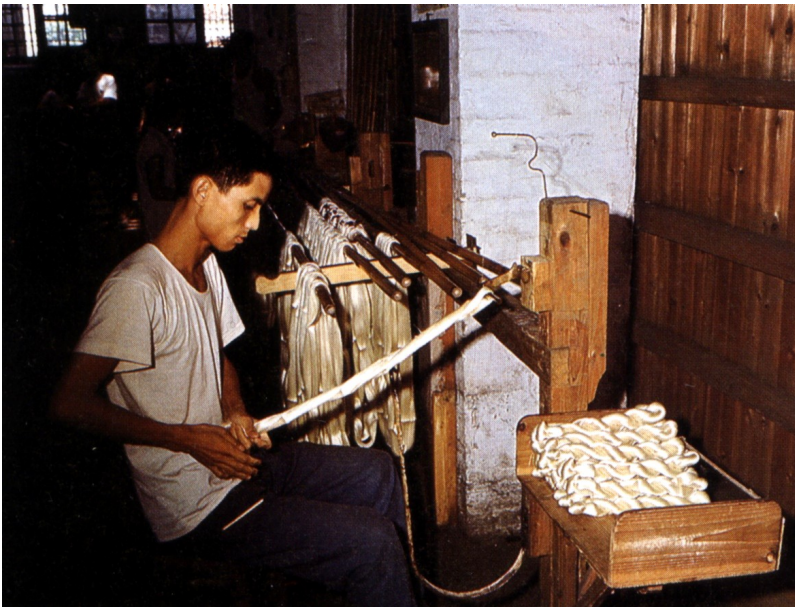
Hodvábná niť sa zmotáva z neporušených vlákien 5-8 zámotkov a navíja sa na vreteno. Na obrázku je vidno tradičné drevené koštruktie.