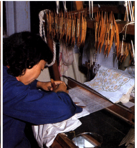
Vretená s hodvábnom sa farbja a používajú na výrobu látok alebo na vyšívanie.